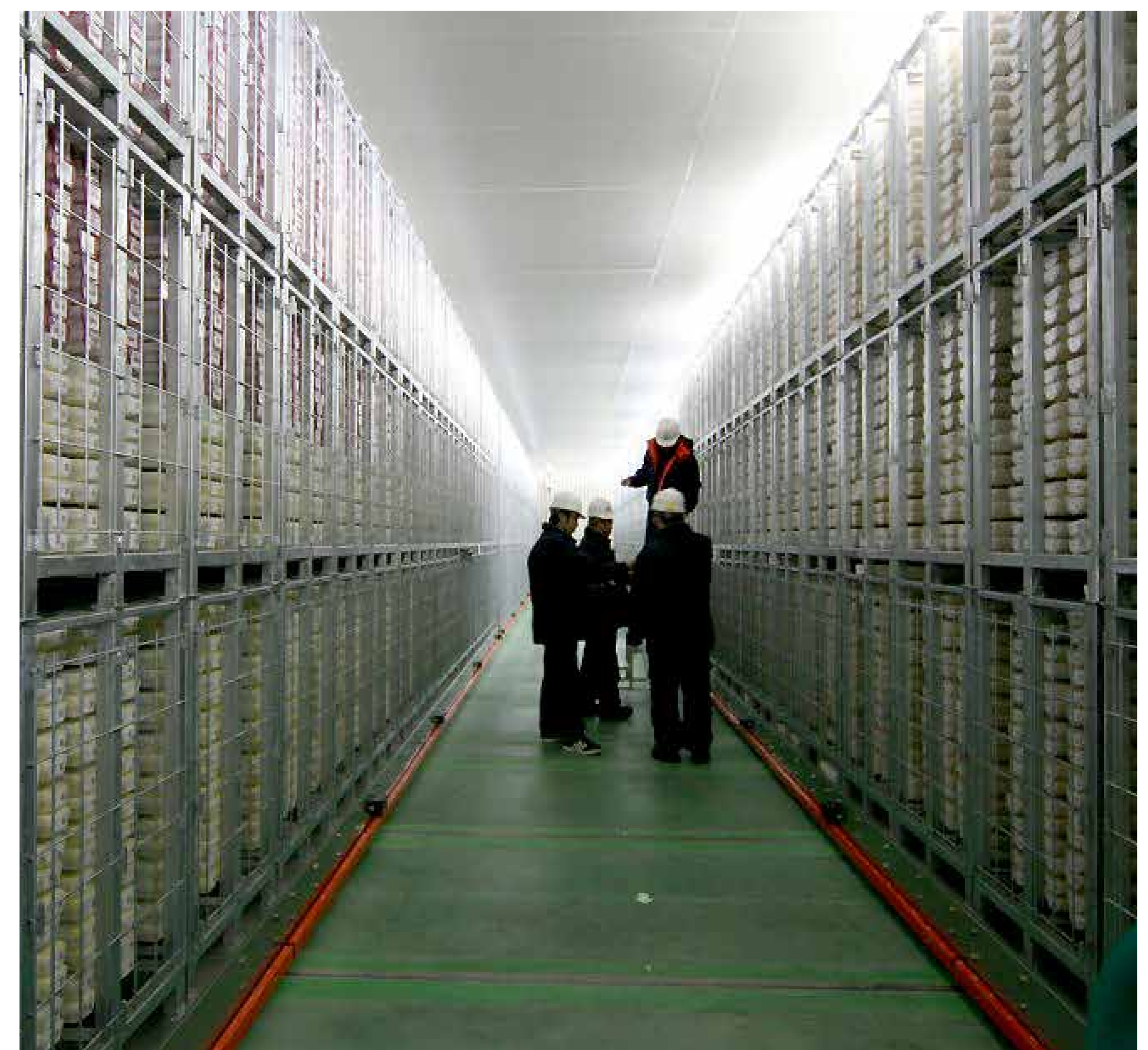
写真：高知コアセンターの様子