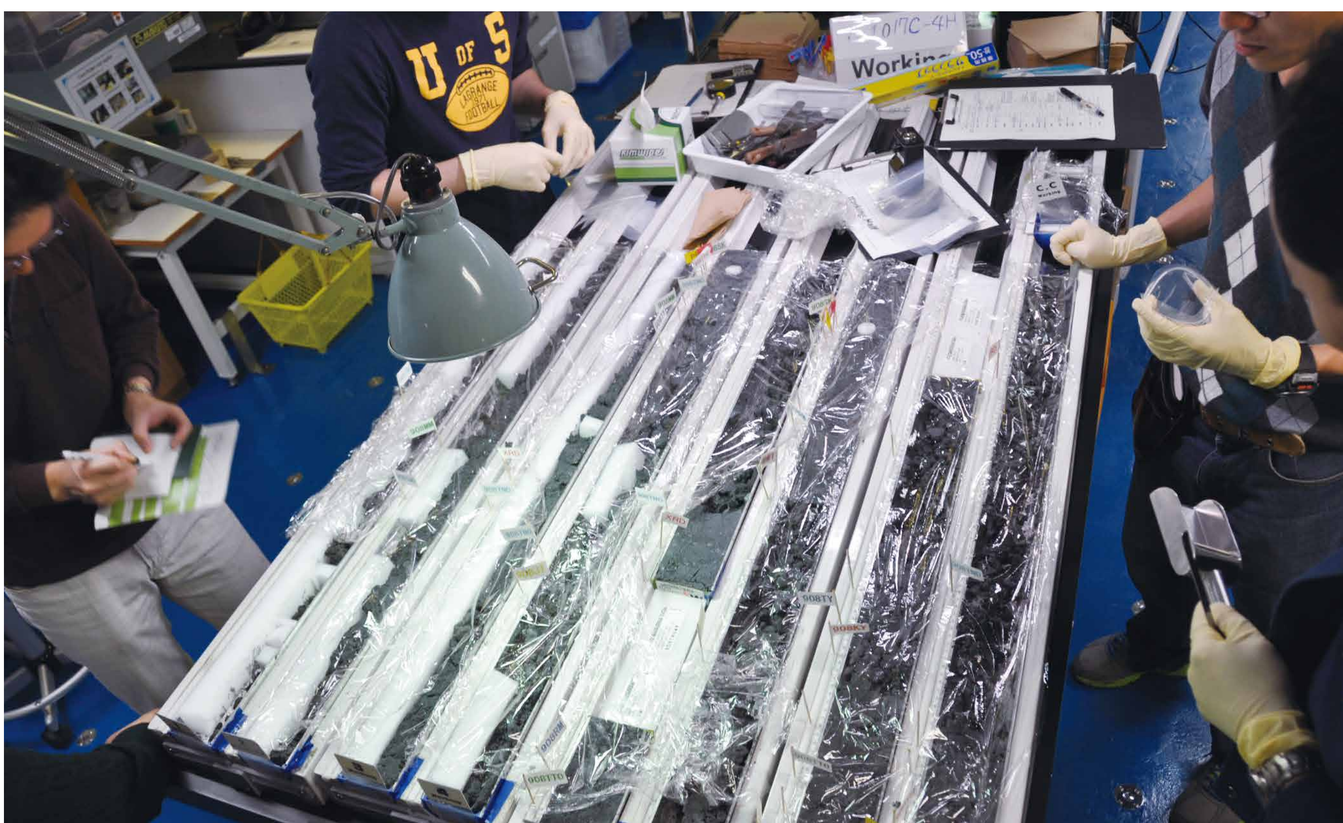
▲採取した海底下熱水鉱床の母体となる硫化鉱物濃集層の一部

※掘削同時検層：地質の特性や断層を把握するため、ドリルパイプの先端近くに物理計測センサーを搭載し、掘削と同時に孔内で各種計測を行うこと。