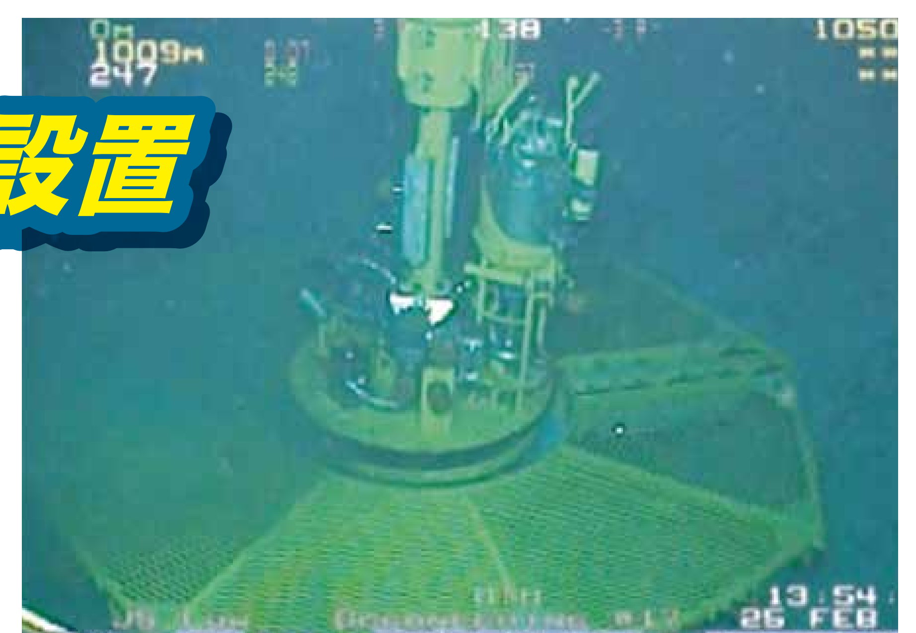
▲設置した長期モニタリング装置