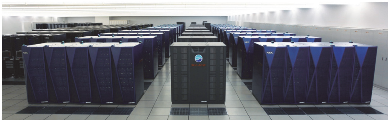
図2 新地球シミュレータ

5月末には全システムの検収を完了して、6月より正式運用を開始しました。検収に当たっては、システムが運用に耐えうるものであることを担保するため、機能、性能が提案仕様を満たしていることを、それぞれ914項目、13項目の実証検査で確認するとともに、試験運用での負荷環境下での二週間の連続運用とその間90%以上の資源が利用可能であることを要件とする可用性検査を実施し、新地球シミュレータシステムは、利用率98.985%で検査合格となりました。性能試験では、調達時の性能評価試験に用いたベンチマークプログラムで実測を行なったが、実際のシステムは、コンパイラの改善などが寄与し、入札時の報告値を実測値が2~5%上回ることが確認されました。性能評価試験に基づけば、ES2に比べて、新地球シミュレータでは、同数のCPUを用いれば、平均2.1倍(プログラムを変更しない場合)~2.8倍(プログラムを新システムに合わせて変更した場合)の性能を得られることが示されています(表1、図3)。