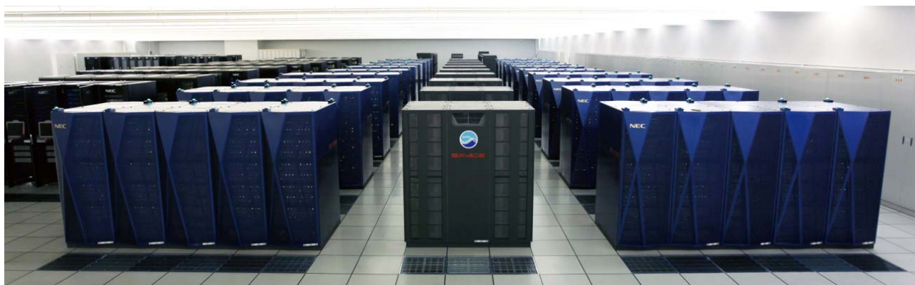
図2：地球シミュレータ (ES3)

検収に当たっては、システムが運用に耐えるものであることを担保するため、機能、性能が提案仕様を満たしていることを、それぞれ914項目、13項目の実証検査で確認するとともに、試験運用での負荷環境下での二週間の連続運用とその間90%以上の資源が利用可能であることを要件とする可用性検査を実施し、ES3は可用性 98.985%で検査合格となりました。性能試験では、調達時の性能評価試験に用いたベンチマークプログラムで実測を行いました。実際のシステムは、コンパイラの改善などが寄与し、入札時の報告値を実測値が2~5%上回ることが確認されました。性能評価試験の結果から、ES2に比べて、ES3では、同数のCPUを用いれば、平均2.1倍(プログラムを変更しない場合)~2.8倍(プログラムを新システムに合わせて変更した場合)の性能を得られることが示されています(表1、図3)。