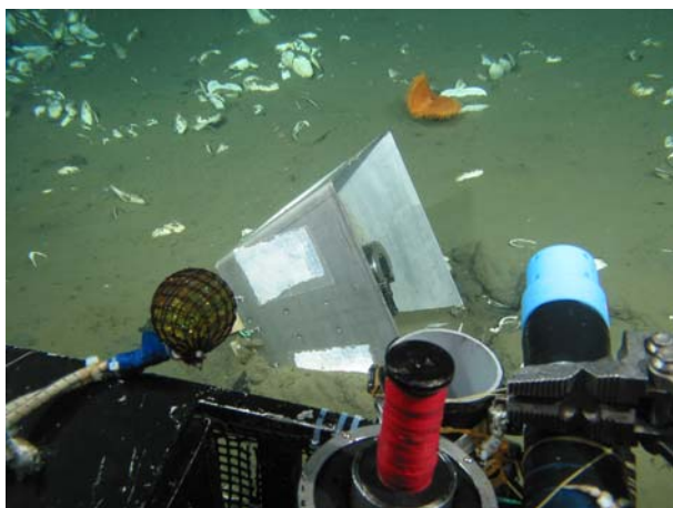
平成 18 年 4 月 22 日の状況