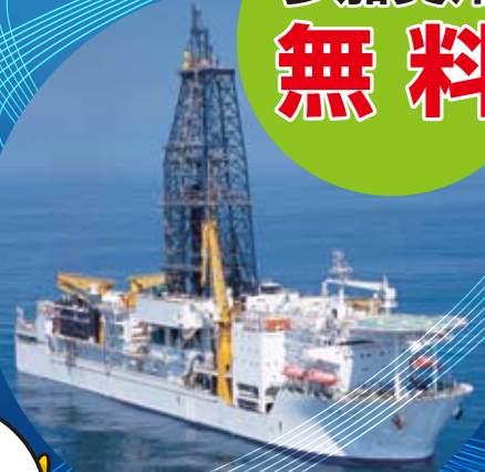
地球深部探査船「ちきゅう」