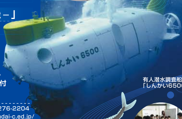
有人潜水調査船 「しんかい6500」