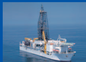
地球深部探査船「ちきゅう」 海の底をドリルで掘って地球の内部を調べる船です。