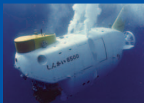
有人潜水調査船「しんかい6500」 人を乗せて世界で一番深くもぐれる潜水船です。