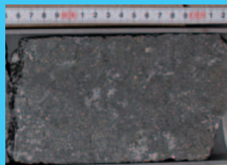
「沖縄熱水海底生命圏掘削」で採取した黒硫のコアを限定特別公開!