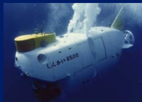
有人潜水調査船「しんかい6500」 人を乗せて世界で一番深くもぐれる潜水船です。