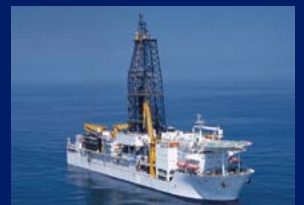
地球深部探査船「ちきゅう」 海の底をドリルで掘って地球の内部を調べる船です。