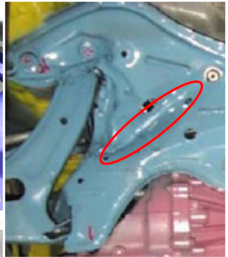
実際の衝突実験結果写真