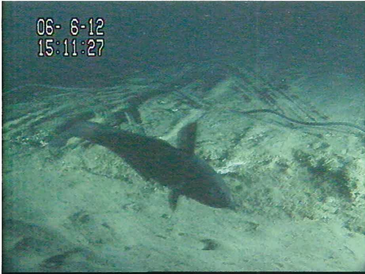
写真3：先端観測ステーションに備え付けられた深海カメラからの映像 写真の魚はソコダラ (rattail fish) の一種