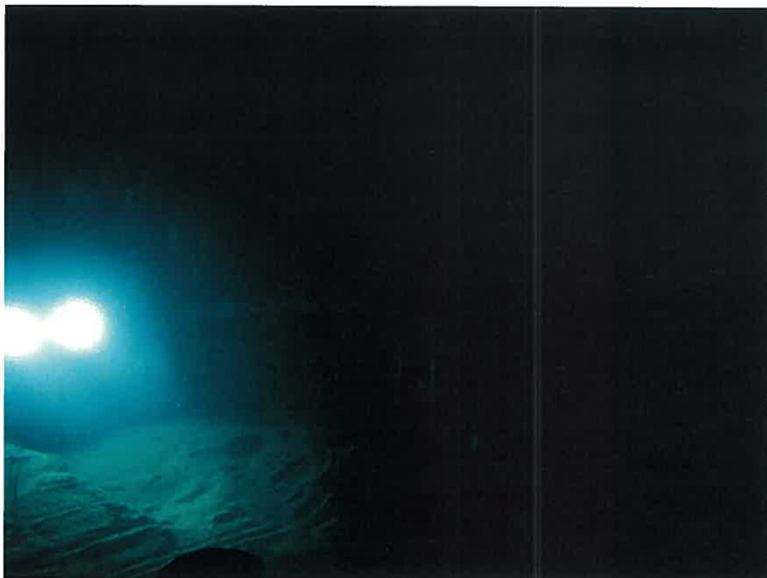
写真 1 深海底に明かりをともす LED 照明システム