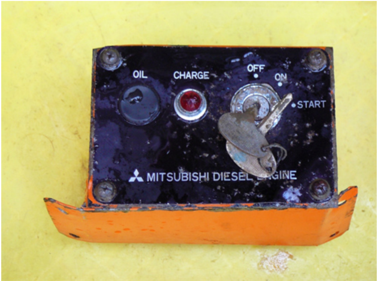
写真1 (北緯34度31分、東経139度49分 水深1,826m 大きさ 縦:約10cm、横:約14cm、高さ:約10cm)