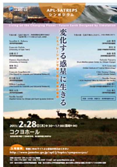
チラシ [PDF : 876KB]