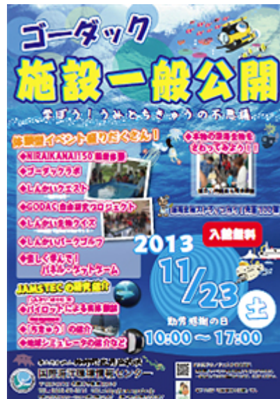
ポスター[PDF : 2.23MB]