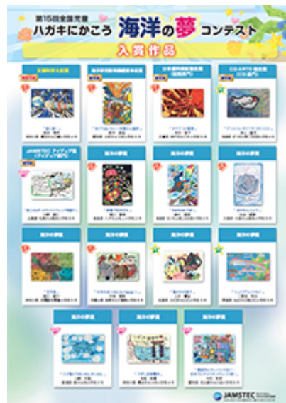
第15回 入賞作品 [PDF : 3.73MB]