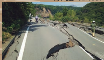
熊本地震

日本で暮らす私たちにとって 避けて通ることができない地震—— 地震とは何か、観測や調査は どのように行われているのか、 愛媛に被害を及ぼす地震 について紹介します。