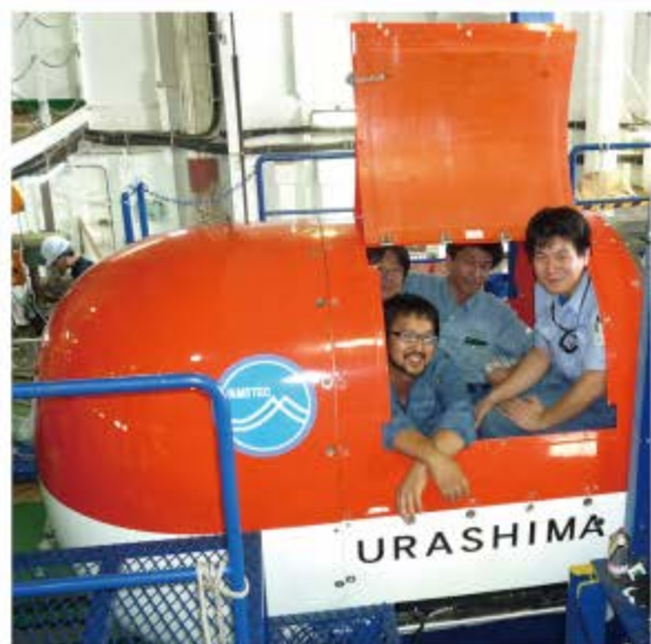
ペイロードスペース：大人 4 人入れる程の容量 (注：「うらしま」は無人探査機ですので、人は乗船しません。)