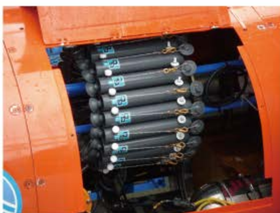
ニスキン採水器 (24 本)