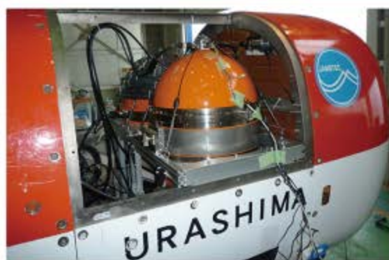
東京大学が開発を進める移動体搭載型重力計