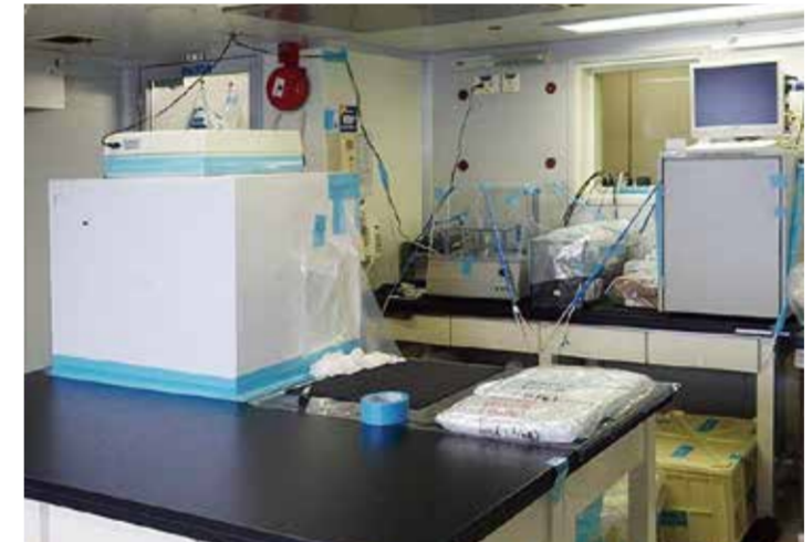
無菌状態での実験を行う第4研究室(クリーンルーム)