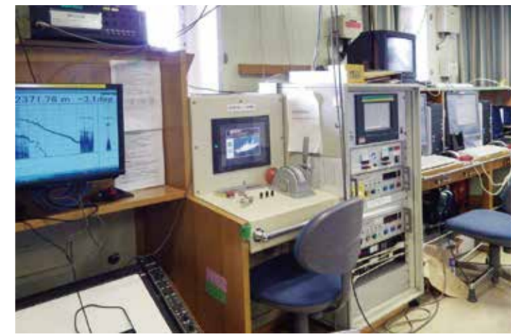
CTD解析処理装置、深海用音響測深装置が並ぶ第3研究室