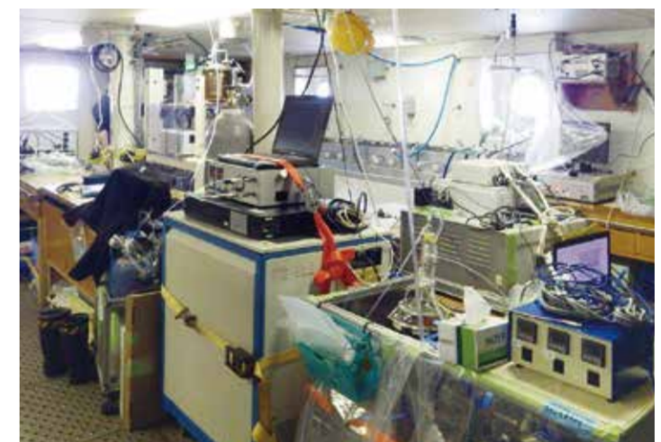
サンプル処理が行われる第7研究室(ウェットラボ)