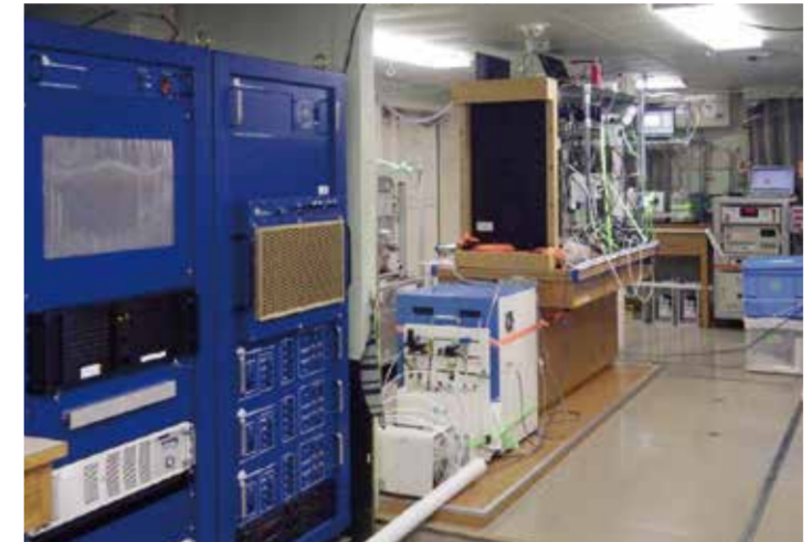
海底地形調査・気象観測を行う第1研究室